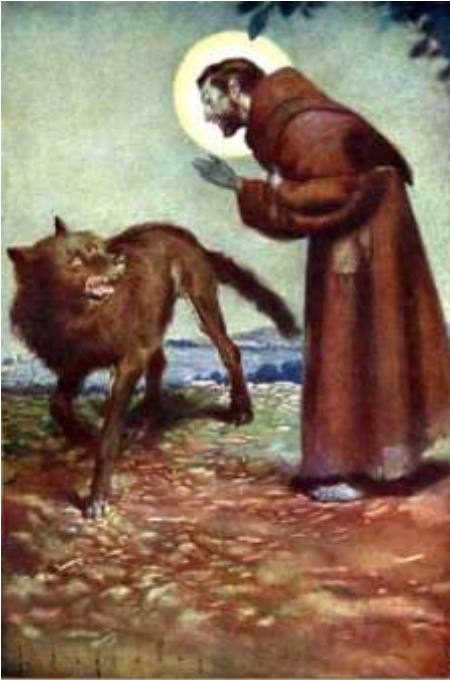
J. Segrelles: -- ¡Ven aquí, hermano lobo!

El lobo, obediente, marchó con él como manso cordero, en medio del asombro de los habitantes. Corrió rápidamente la noticia por toda la ciudad; y todos, grandes y pequeños, hombres y mujeres,