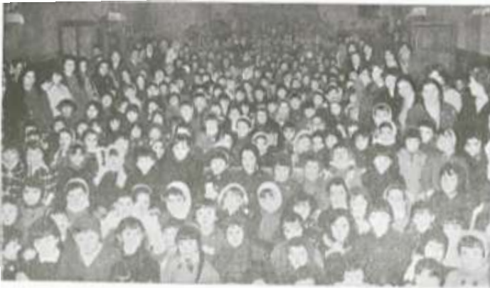
Grupo juvenil de los niños de la Catequesis de la Sagrada Familia.