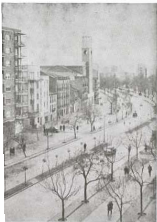
a Dehala y la torre de San Antonio en la gran perspectiva del Paseo de Zaragoza.

La mayoría de nosotros, llevamos desde pequeños aquí. Empezamos a venir a catequesis de comunión, los sábados al “Rincón de los peques”, donde lo pasábamos genial. Unos nos hemos confirmado, otros lo harán pronto y todos seguimos viniendo a esta nuestra parroquia. Nos gusta seguir conviviendo con la gente que empezamos cuando éramos pequeños. Estamos creciendo aquí. Hemos pasado de ir con la mochila y cara de expectación a nuestro primer campamento a ser monitores de niños que tienen la misma ilusión que nosotros. Desde aquí animamos a padres, niños, jóvenes, fieles a participar en la parroquia de forma activa y a catequistas y frailes a continuar con esta labor y seguir adelante con las actividades de la parroquia.